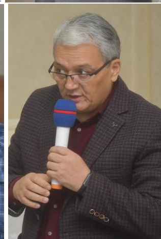
Дискуссионная панель Диалоговой площадки